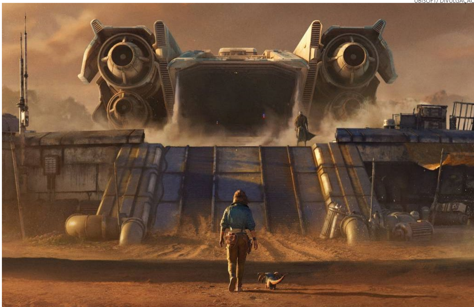
Novidade: ‘Star Wars Outlaws’ aposta em protagonista com perfil pouco explorado na indústria

Kay Vess, interpretada pela atriz Humberly González, é uma malandra que tenta fazer fama e