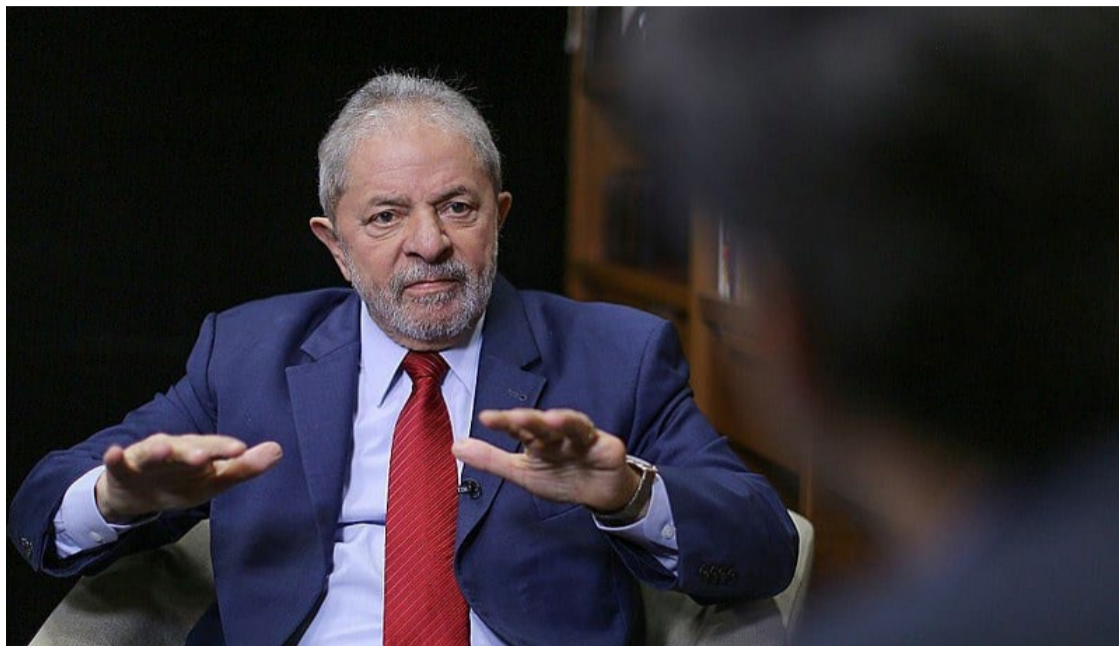
Lula da Silva: Donald Trump vai tirar proveito eleitoral do atentado

Ele disse que quem pede perdão a algum crime antes mesmo de ser condenado está confessando ter realizado algo de errado. “Primeiro, você espera ser condenado, você vai ser processado, você vai ser julgado. Aí, sim, você pode discu-