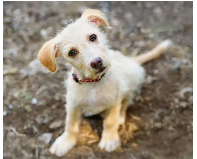
Cães exibiram mais comportamentos de estresse e vocalizações em resposta ao choro humano

Pesquisas mostraram que, mesmo quando os humanos não conseguem reconhecer com precisão o afeto nas vocalizações dos animais, estruturas cerebrais ainda reagem de forma diferencial à valência emocional desses sons. Isso sugere uma habilidade profunda e enraizada de processar o conteúdo emocional nas vocalizações, destacando a importância dos sinais vocais na emoção e comunicação animal.