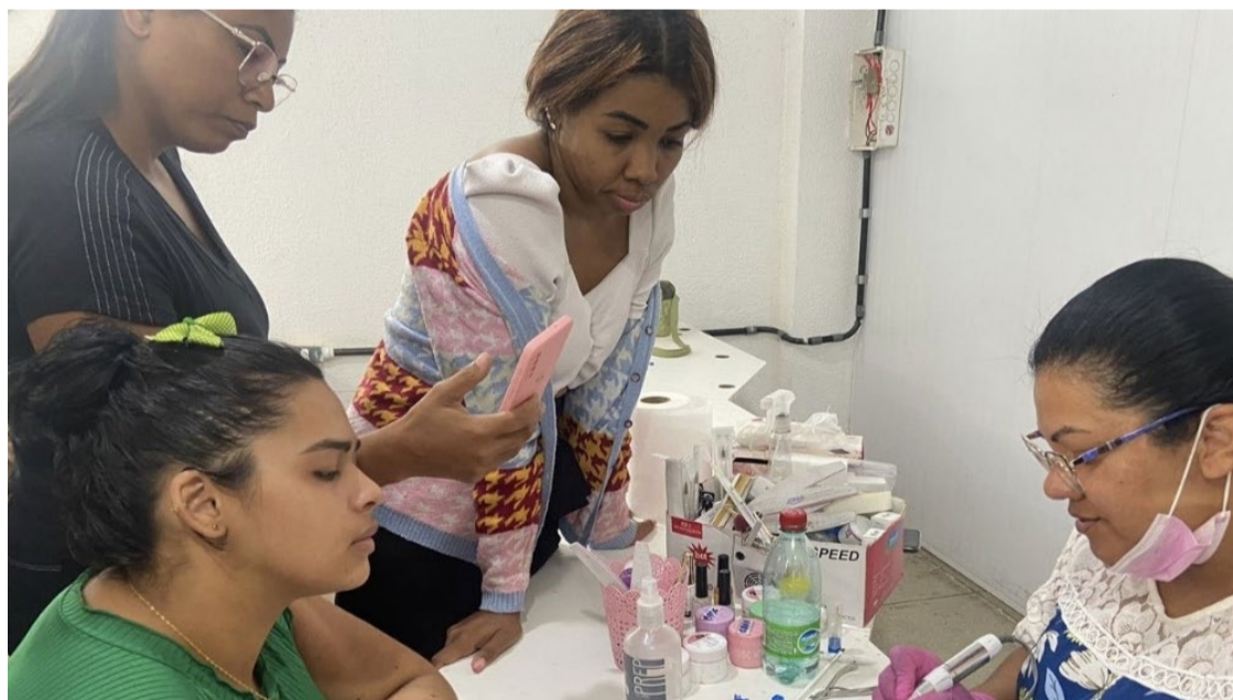
Cursos de alongamento de unhas, modelagem e henna para sobrancelhas estão na lista do Sine

As aulas serão ministradas a partir da próxima segunda-feira (22/7), na Faculdade Delta, na avenida São Carlos, 911, Jardim Planalto, pela manhã, tarde e noite, com término das últimas turmas em 3 de setembro, com carga horária que varia de acordo com o curso, entre 40 e 160 horas.