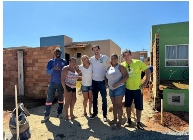
Além das casas, uma praça foi construída para os moradores

O começo do mês de julho marcou o início de uma nova história para 99 famílias contempladas com as casas sorteadas pela prefeitura de Senador Canedo