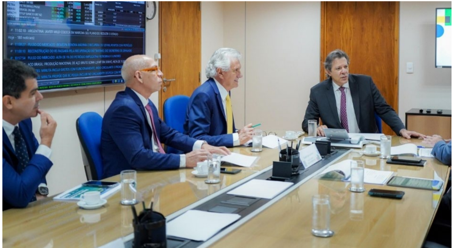
Ronaldo Caiado e ministro Fernando Haddad: gestor requer manutenção de benefícios concedidos a Goiás

Atualmente, o RRF oferece dois instrumentos principais para o reequilíbrio das contas públicas: a suspensão do pagamento da dívida e a sua rees-