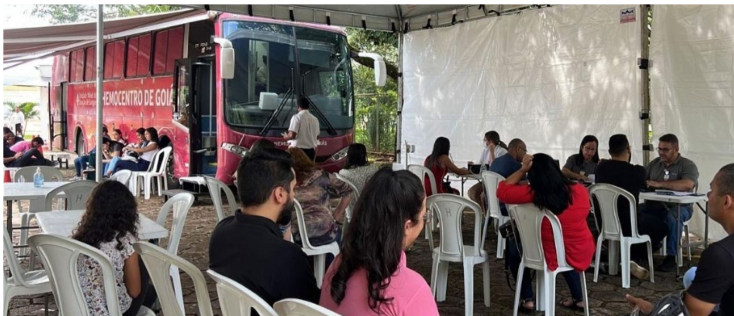
Procura por sangue nas maternidades municipais de Goiânia é alta, informa a Prefeitura: ação envolve coleta externa

A demanda por sangue nas maternidades municipais de Goiânia é alta, visto que vários procedimentos e tratamentos podem levar o paciente a precisar de transfusões de sangue e, para isso, é preciso ter estoque dispo-