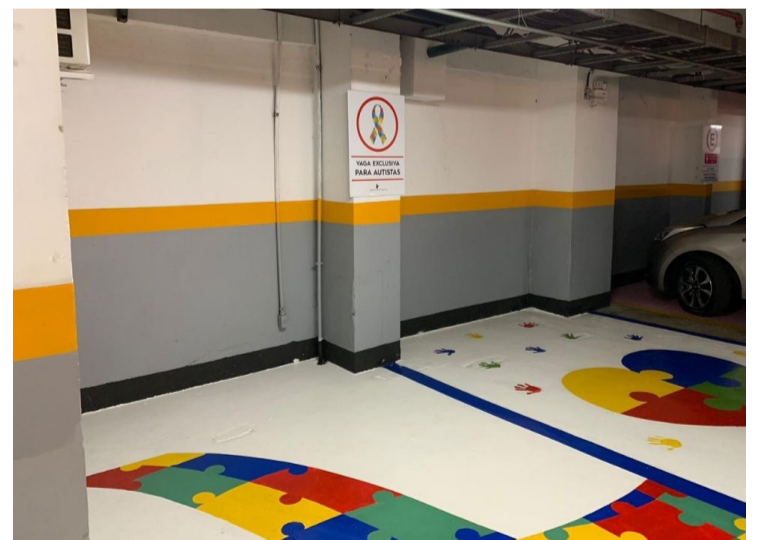
Vagas exclusivas para pessoas autistas foram implantadas em shoppings

Documentos necessários: Relatório Médico conforme a portaria, requerimento ao diretor de Operações do Detran, documento de identificação com foto e CPF da pessoa com TEA e do seu representante legal, se for o caso.