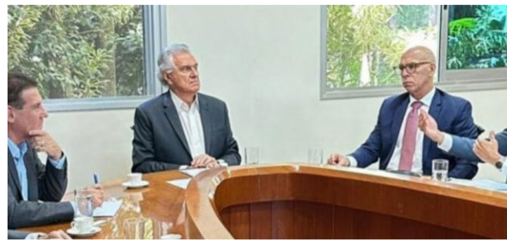
Ronaldo Caiado e Vanderlan Cardoso: temas de interesse de Goiás