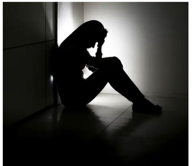
1 em cada 7 adolescentes enfrentam problemas de saúde mental em todo o mundo

A saúde mental dos adolescentes é impactada por múltiplos fatores de risco e agravada por situações como a pandemia de COVID-19. Desenvolver mecanismos de enfrentamento eficazes e proporcionar ambientes de apoio são essenciais para promover o bem-estar psicológico dos jovens. É importante que pais e cuidadores incentivem a comunicação aberta e validem os sentimentos dos adolescentes, ajudando-os a ver desafios como oportunidades de crescimento.