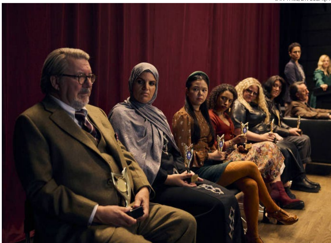
Cineasta tenta mostrar que cultura é dominada por gente medíocre

As causas de Denys Arcand são evidentes. A cultura é dominada por gente medíocre. A sociedade só é coletivista na busca pela mediocridade. As lutas das minorias se encaminham, por mais válidas que sejam, reescrevendo irresponsavelmente a história da arte, enquanto o etarismo voa livre e solto, corroendo a ideia de jus-