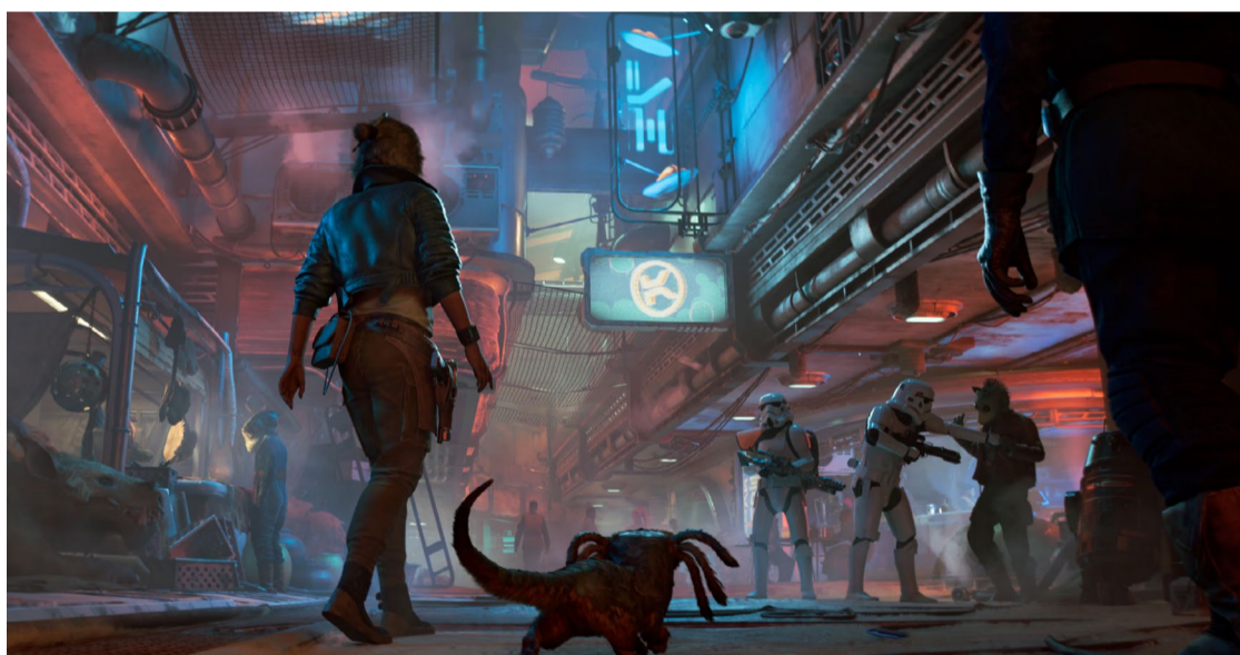
Mundo: Jogador pode “andar” por cinco planetas diferentes

fortuna no submundo da Orla Exterior, uma espécie de Han Solo em começo de carreira em versão feminina. Sua história se passa entre os acontecimentos dos filmes “O Império Contra-Ataca” e “O Retorno de Jedi”, trazendo, além da temática, uma experiência visual que remete à trilogia original de “Star Wars”.